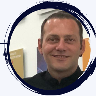
Dr. Tolga ŞİNOFOROĞLU

Fair Play Eğitiminde Yaratıcılık: Fair Play Materyalleri